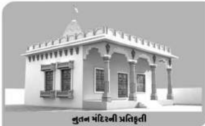
નુતન મંદિરની પ્રતિકૃતિ

હજાર હાથવાળા એ આપણને સહુને ઘણી વખત એમણે કરેલ ઋણની ચુકવણી માટે અનેક તકો આપતા હોય છે, પણ આપણે એ તરફ દુર્લક્ષ સેવતા હોઈએ છીએ. આમ તો દુનિયાની નજરમાં આપણે સક્ષમ હશું પણ આપણે બે મહાસાગર અર્થાત-આપણા કુળદેવતા-કુળદેવીના ઋણ ચૂકવવા અસમર્થ છીએ.